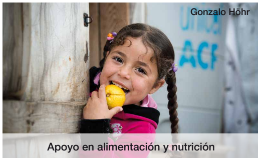
Apoyo en alimentación y nutrición