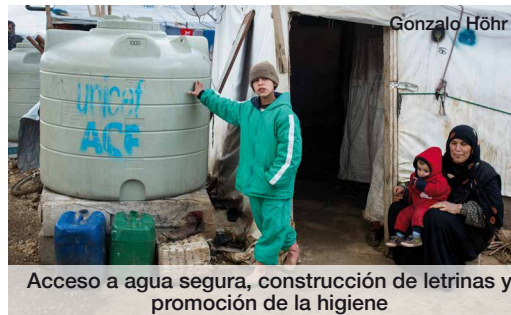
Acceso a agua segura, construcción de letrinas y promoción de la higiene