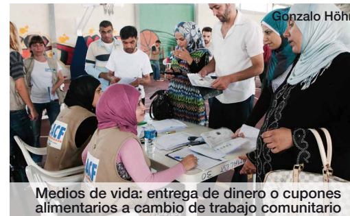
Medios de vida: entrega de dinero o cupones alimentarios a cambio de trabajo comunitario